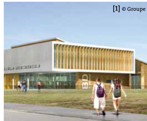
[1] © Groupe 3

Construit sur l'ancienne gare SNCF d'Elbeuf, le nouveau collège Nelson Mandela, ouvert à la rentrée 2011 est intéressant tant au niveau du programme que de sa réalisation. Coté programmation, on est passé d'un projet initial de réhabilitation de l'ancien collège à la construction d'un nouvel établissement. En résulte un nouvel édifice HQE repositionné au cœur de la ville.