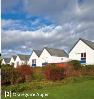
[2] © Grégoire Auger