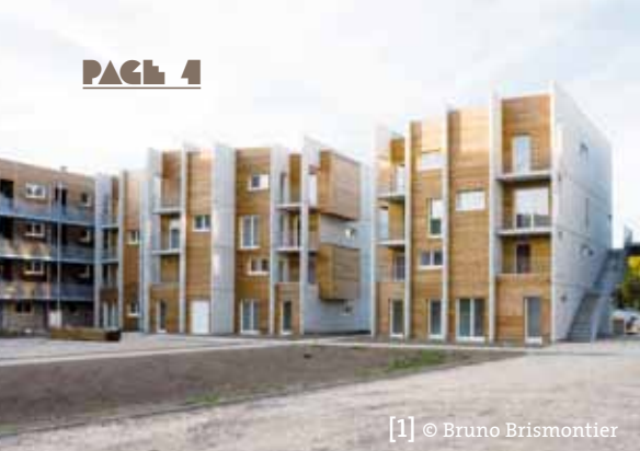
[1] © Bruno Brismontier