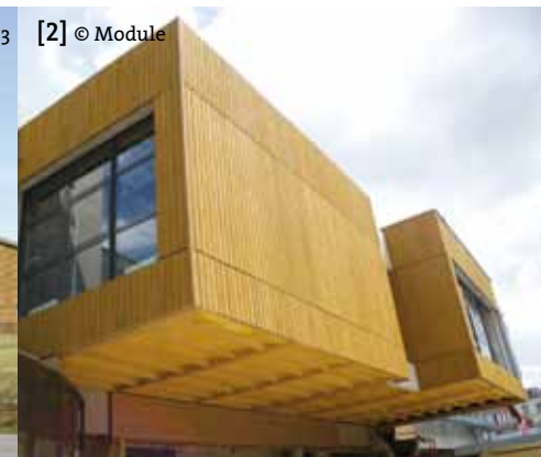
[2] © Module